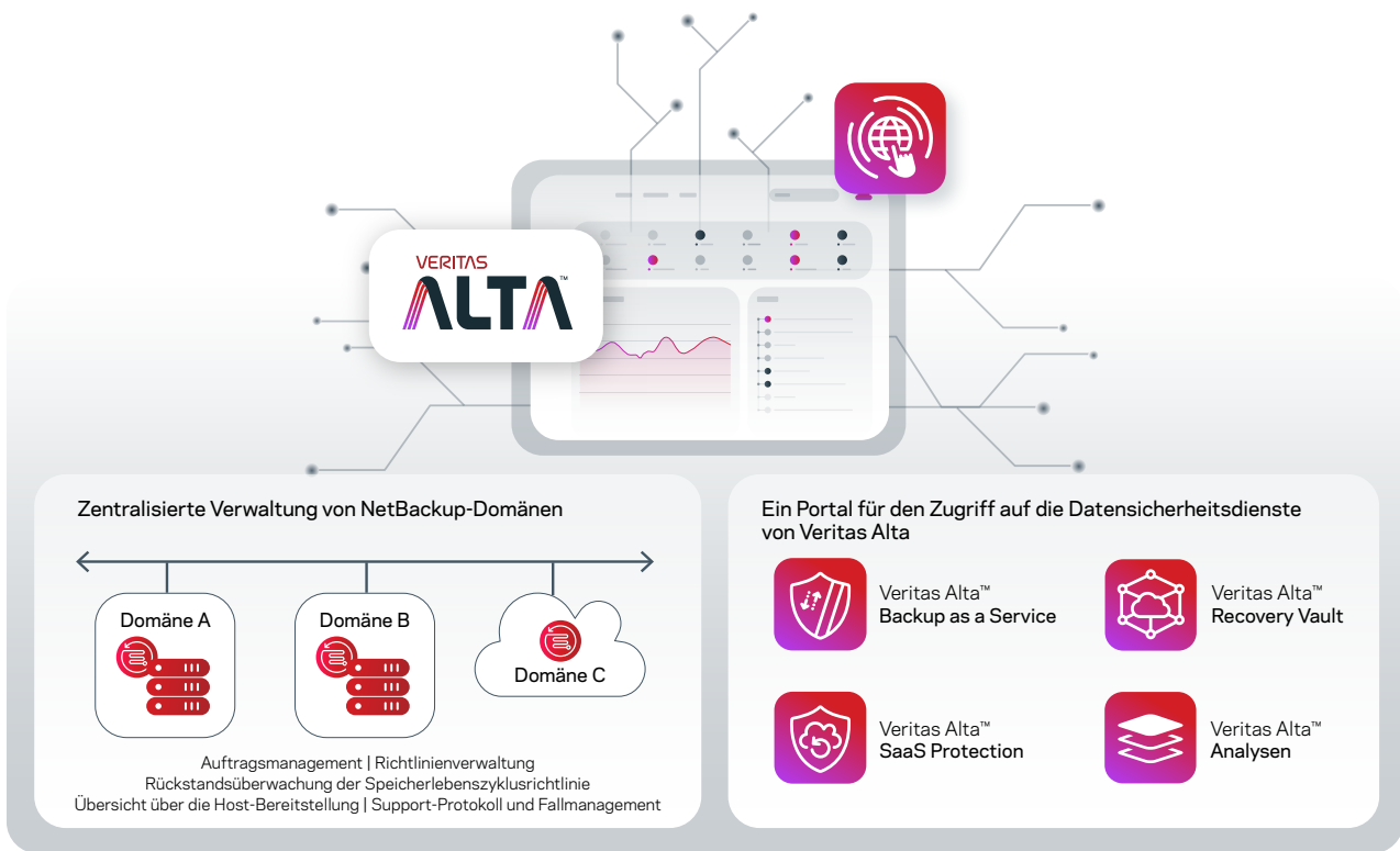
Abbildung 1. Ein einheitliches, standardmäßig gesichertes Portal zur Verwaltung aller Ihrer Datensicherheitsdienste