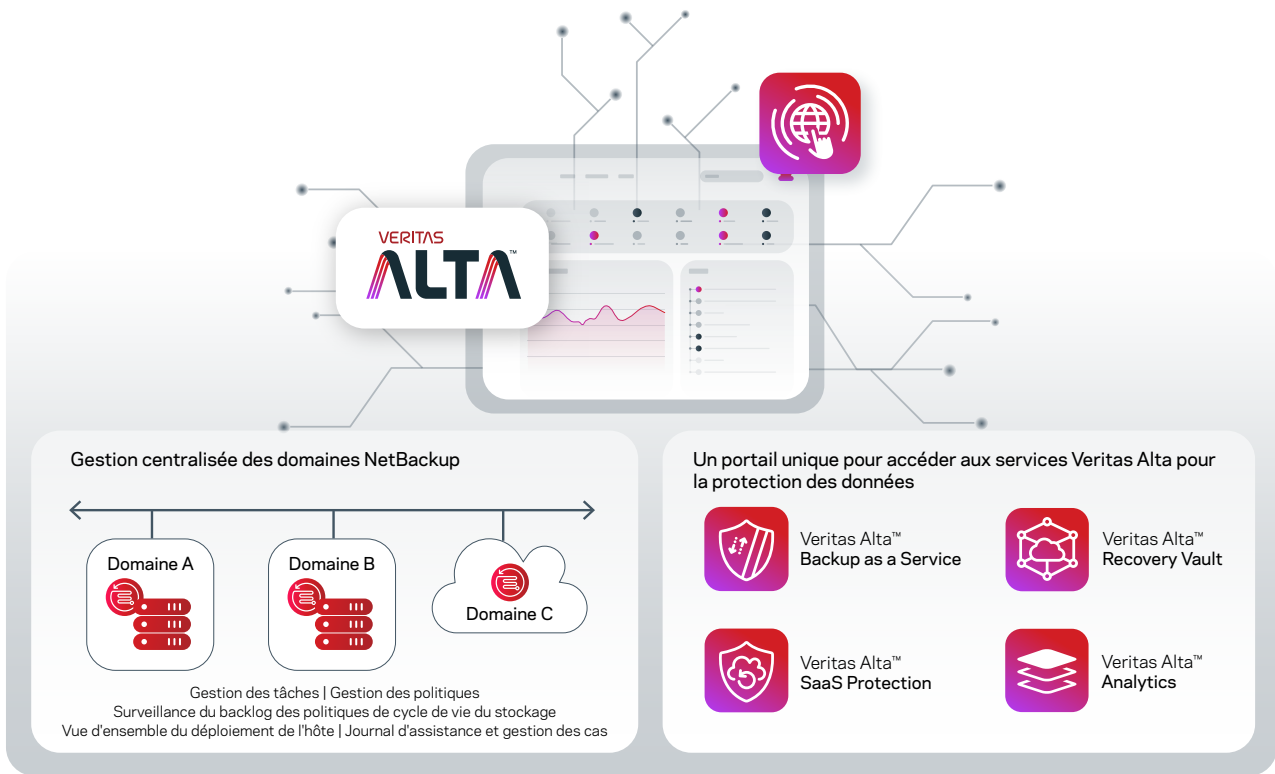
Figure 1. Un portail unifié, sécurisé par défaut, pour gérer l'ensemble de vos services de protection des données