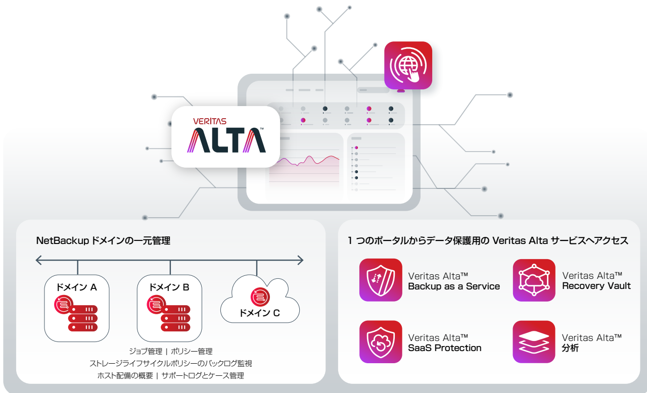
図 1. デフォルトでセキュリティが確保された統合ポータルですべてのデータ保護サービスを管理