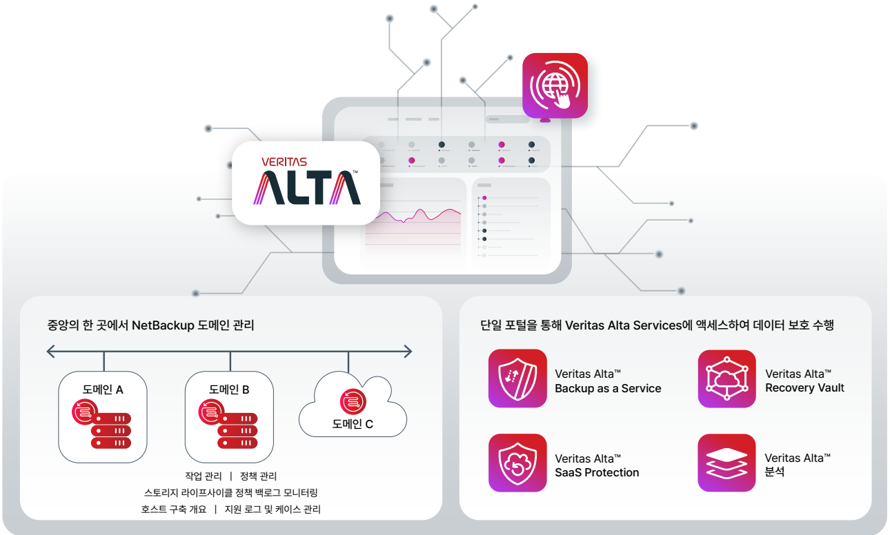
그림 1. 기본적으로 보안이 구현된 단일 통합 포털에서 모든 데이터 보호 서비스 관리